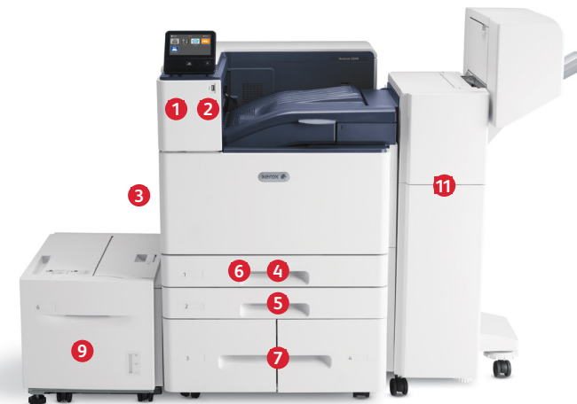
Xerox® VersaLink® C8000 színes nyomtató Nyomat. Mobilkapcsolatok.

Ha a VersaLink készülékek funkcióiról szeretne többet megtudni, látogasson el a www.xerox.com/VersaLinkEG címre.