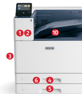
Xerox® VersaLink® C8000 és C9000 Alapkonfiguráció