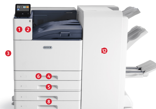
Xerox® VersaLink® C9000 színes nyomtató Nyomat. Mobilkapcsolatok.

1 Kártyaolvasó-foglat és belső kártyaolvasó-rekesz.